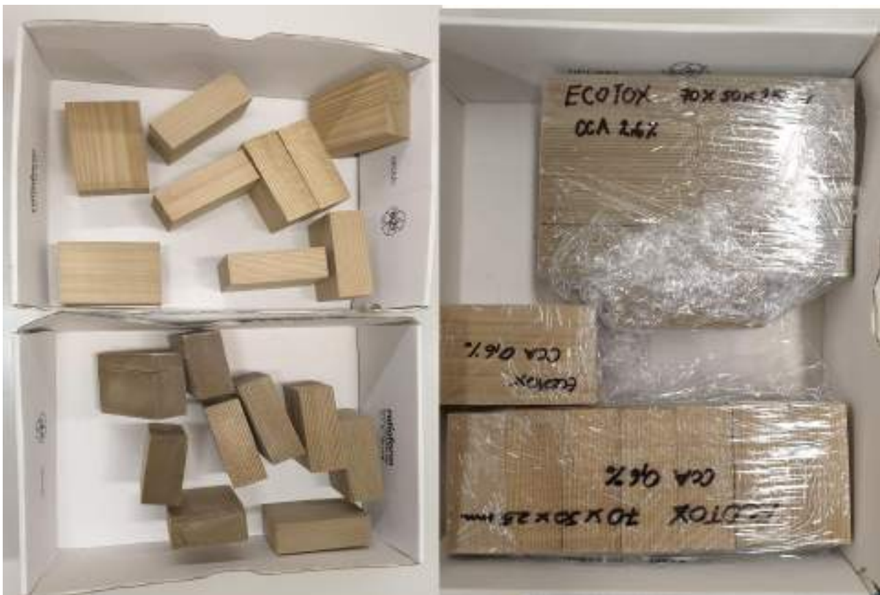
Slika 2: Del vzorcev velikosti 70 × 50 × 25 mm za WP 3.3.3 (ATT16) in WP 3.3.4 (ATT17)