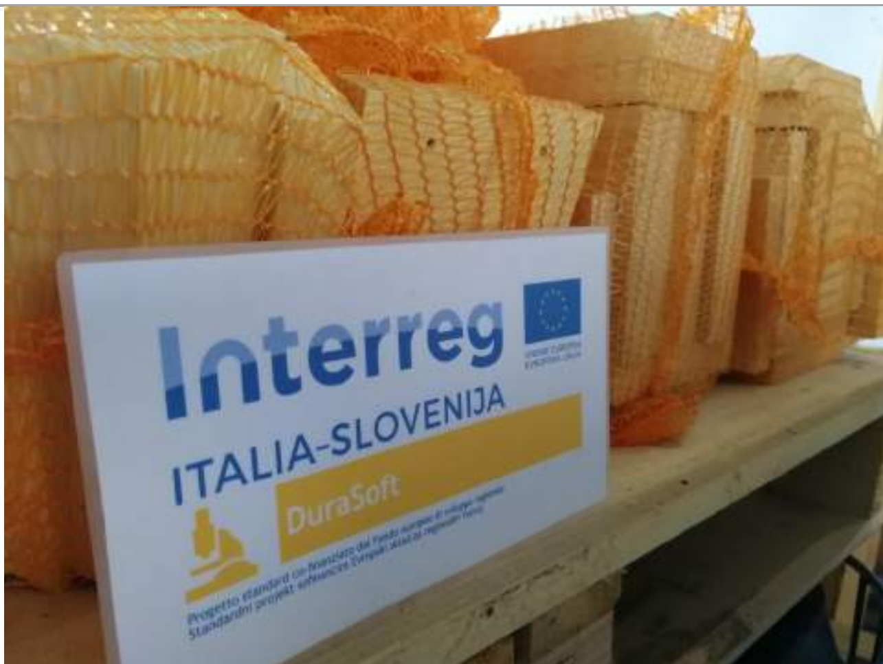
Immagine 4: Campioni EN 275 per le prove in mare nell'ambito dell'ATT8 del WP 3.2.1. Sui lati dei provini sono visibili dei piccoli fori che indicano la modalità di fissaggio dei campioni EN 275 praticata dal lead partner ISMAR durante i test.