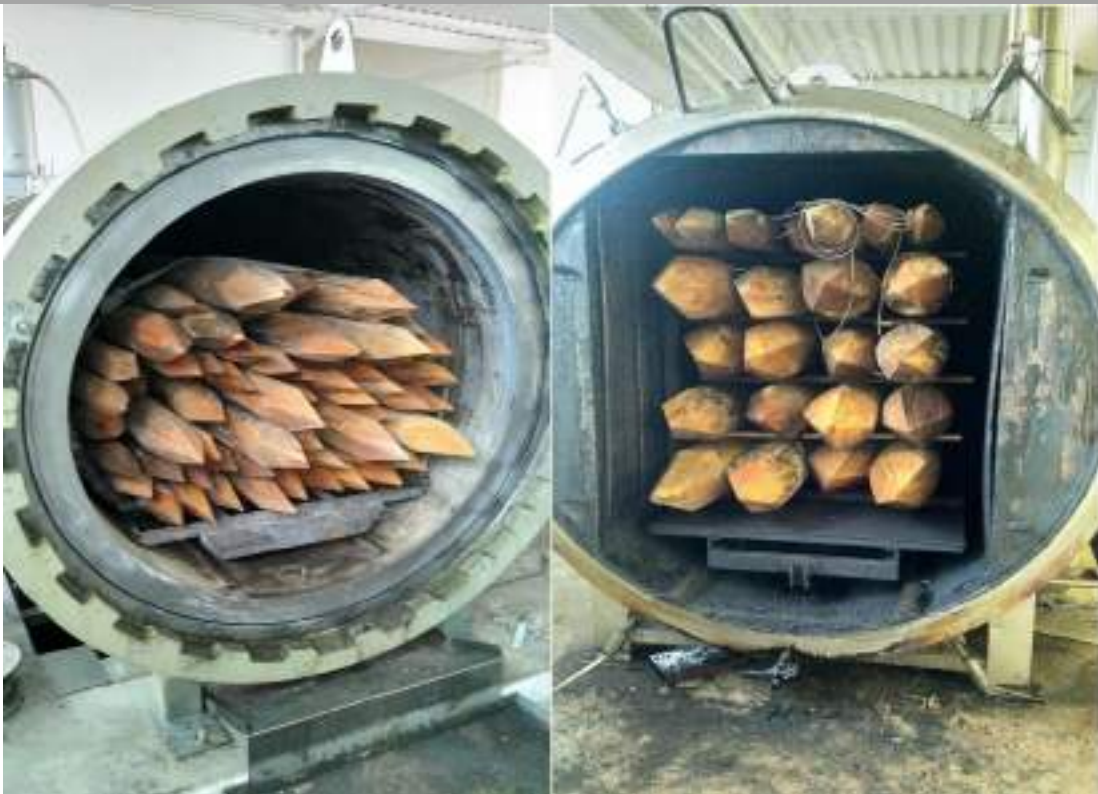
Immagine 8: A sinistra - preparazione di una porzione di pali da sottoporre a impregnazione sottovuoto in autoclave con l'uso di uno dei preparati; a destra – porzione di pali trattati mediante modifica termica.