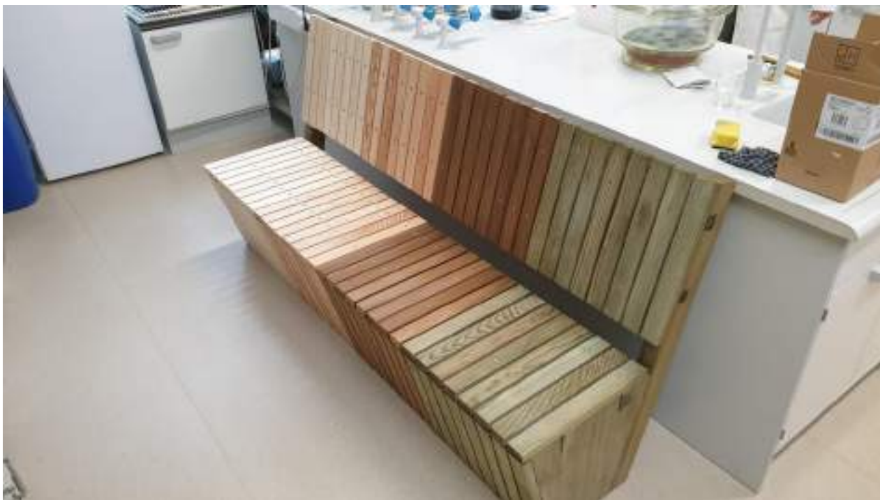
Slika 12: Ena od testnih klopi, ravnokar sestavljena v laboratoriju. V sklopu projekta DuraSoft je bilo izdelanih 7 takih klopi, ki so bile nato v izpostavljenosti za testiranja v delovnem sklopu WP 3.2.4 v aktivnosti ATT11 na lokacijah v Ljubljani, Seči, Škocjanskem zatoku, Biljah (Orehovlje), Jamljah, Pesnici in na Veliki Planini.