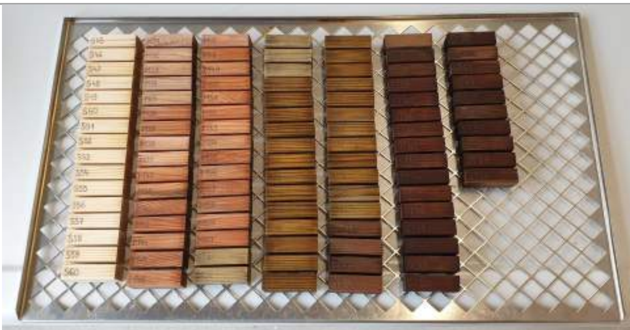
Slika 1: Del vzorcev velikosti 50 × 25 × 15 mm za WP 3.3.1 (ATT14) in WP 3.3.2 (ATT15)