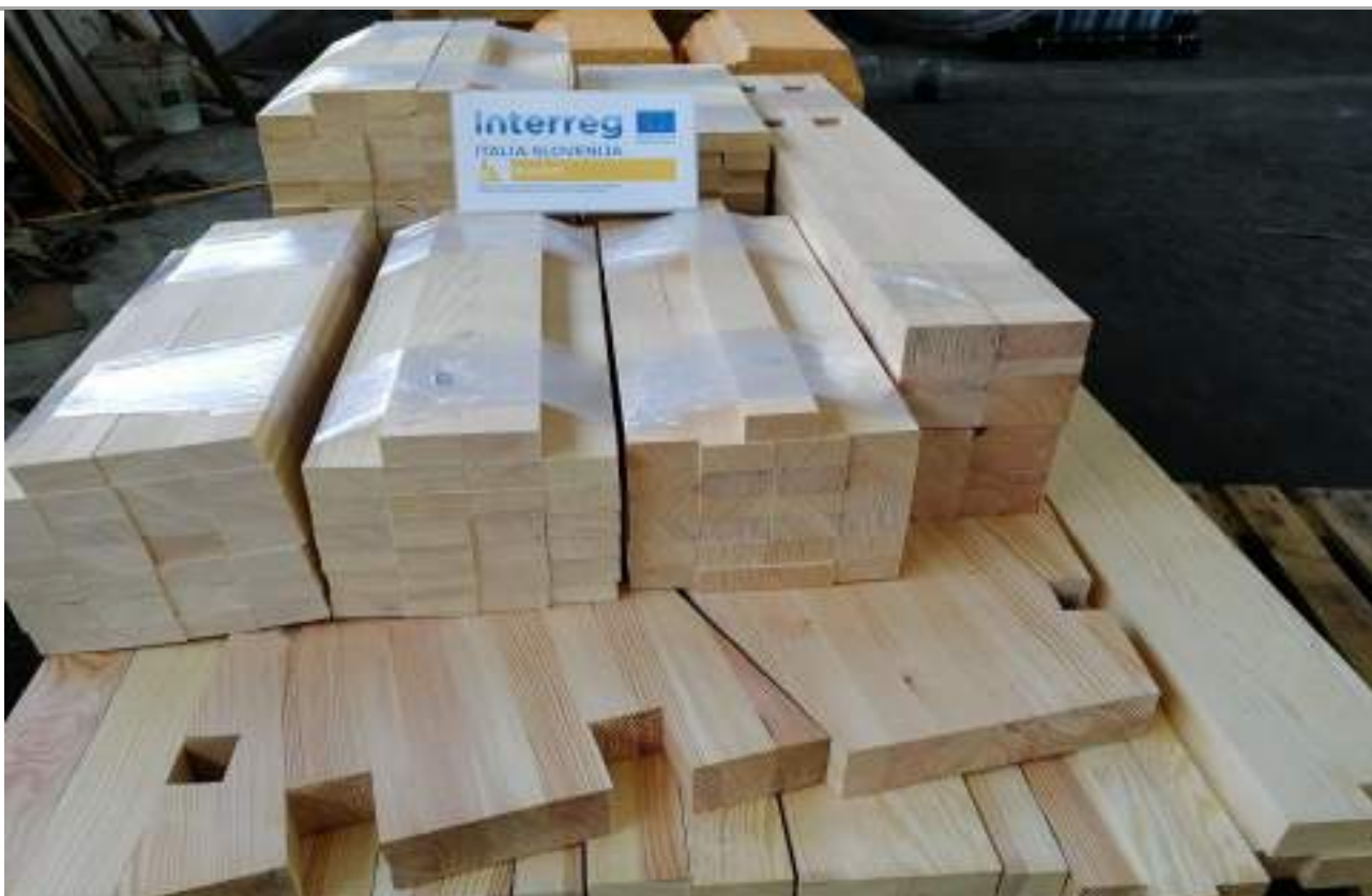
Immagine 5: I campioni EN 252 per le indagini di campo in terra (in alto, sotto il logo DuraSoft) nell'ambito dell'attività ATT10 del WP 3.2.3, sotto i quali sono visibili le gambe delle panchine testate durante le attività ATT11 del WP 3.2.4, poco prima di essere sottoposti a impregnazione con una delle soluzioni mediante il procedimento con vuoto/pressione.