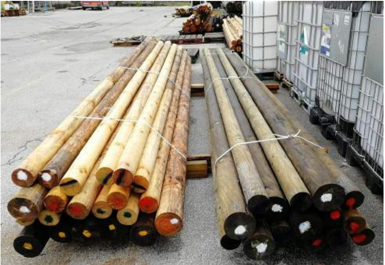
Slika 11: Pripravljeni paketi za dostavo na lokacije (Ljubljana – UNILJ – PP2, Bilje/Orehovlje – UNILJ – PP2, Benetke – ISMAR – LP). Vsak paket vsebuje vse dogovorjene obdelave za testiranje na posamezni lokaciji; Bela pika označuje kole rdečega bora (na levem kupu neobdelane kontrole, na desnem impregnirane po vakuumsko tlačnem postopku), rdeča pika kole bele jelke, modra črta kole navadne smreke, rumena pika kole rdečega bora s tretmajem termične modifikacije in zelena pika kole domačega kostanja. V ozadju so vidni pripravljeni paketi za ostale lokacije.