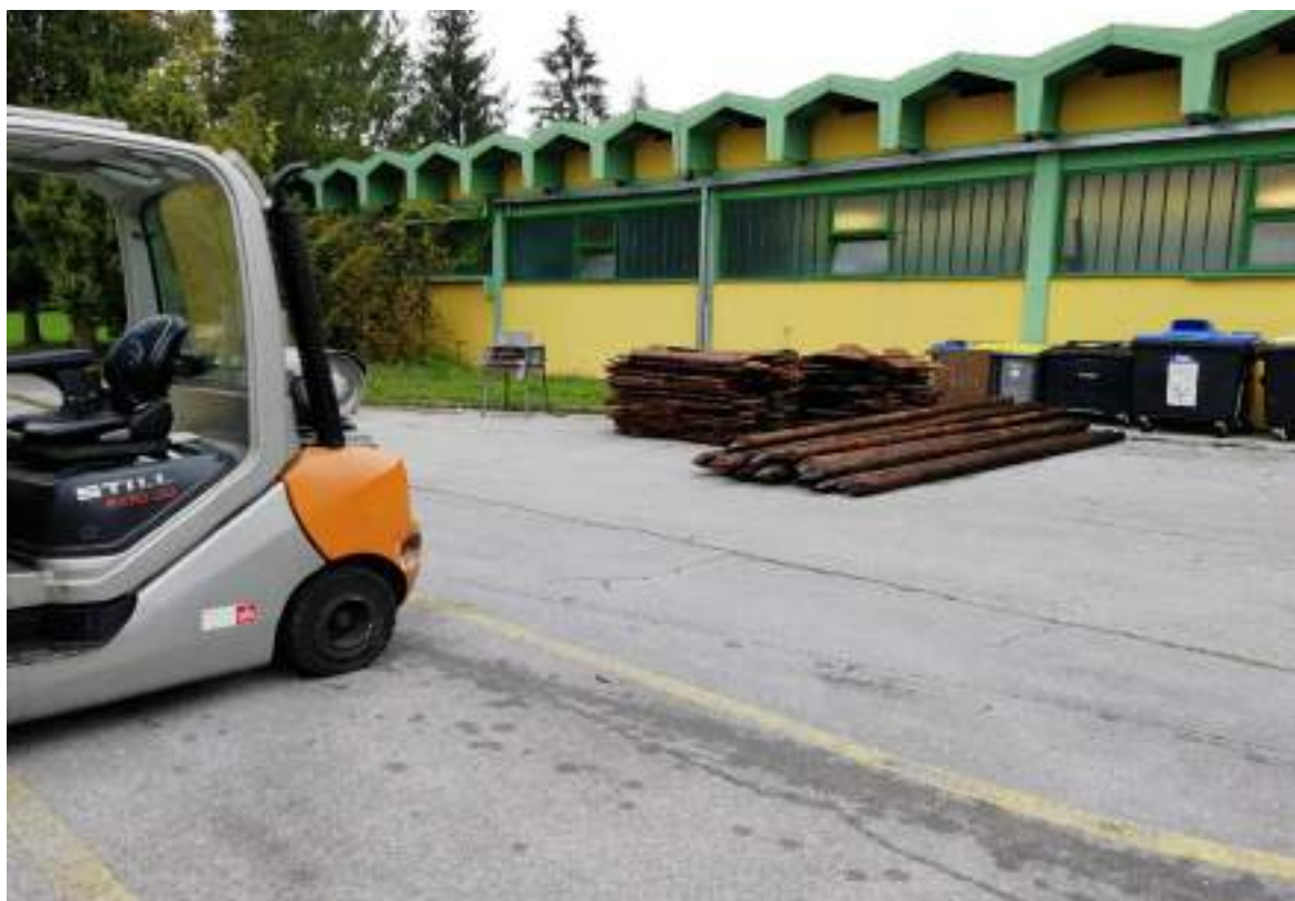
Slika 10: Desno za viličarjem zbrani termično modificirani koli.