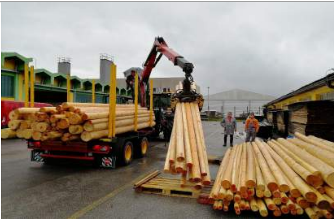
Slika 7: Dostava kolov za izpostavitve v morju (privezi, označevalne poti, ribiške mreže – »fascine«) in v tleh (koli za uporabo v poljedelstvu).