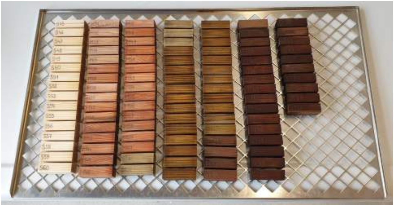
Figura1: Parte dei provini di dimensioni 50 × 25 × 15 mm per WP 3.3.1 (ATT14) e WP 3.3.2 (ATT15).

l'impregnazione sottovuoto in autoclave con l'utilizzo del preparato Silvanolin® e la modifica termica secondo il procedimento Silvapro®. Per le attività ATT14 e ATT15 sono stati predisposti complessivamente 1.000 campioni di dimensioni 50 × 25 × 15 mm (Figura1), per le attività ATT16 e ATT17 oltre 130 provini di dimensioni 70 × 50 × 25 mm e 76 × 26 × 5 mm (Figura2), infine per le attività ATT18 e ATT19 circa 200 campioni di 400 × 150 × 25 mm (Figura3).