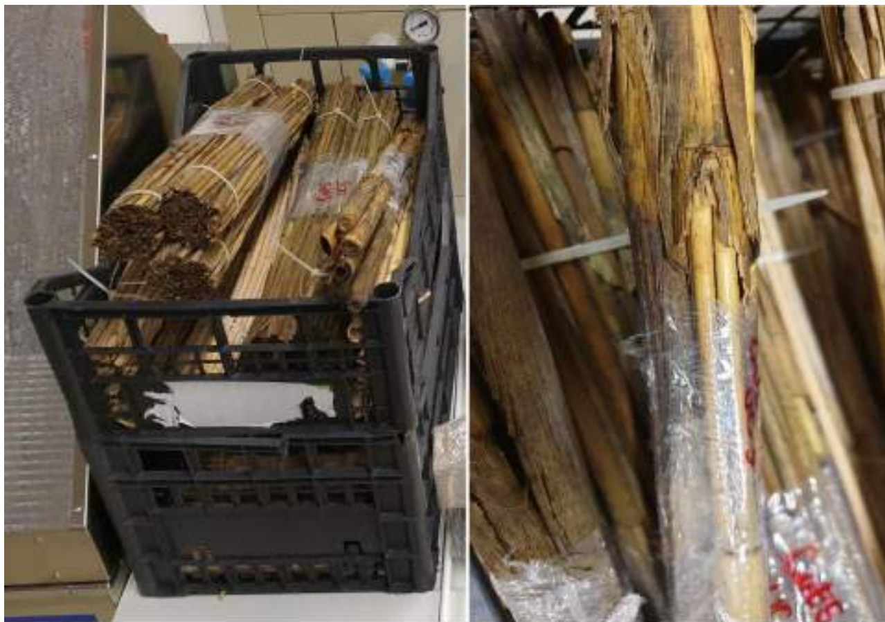
Immagine 6: Campioni di due tipi di cannuccia per i test sul campo, in mare e su manufatti - tetto dei tipici casoni veneziani. Si tratta dei campioni per le prove dell'ATT12 nell'ambito del WP 3.2.5. La cassetta nella foto di sinistra contiene i fasci di cannuccia della palude Phragmites australis a sinistra, mentre a destra è visibile un piccolo fascio di canne Arundo donax .