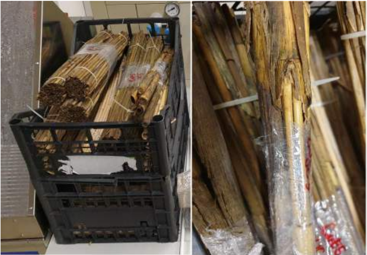
Slika 6: Vzorci dveh vrst trstičja za terenska testiranja, v morju in na realnih objektih – streha tradicionalnih beneških ribiških koč. Gre za vzorce za testiranja v delovnem sklopu WP 3.2.5 v aktivnosti ATT12. Gajbica na levi sliki vsebuje zvitke trsja vrste Phragmites australis – tanjše trstičje, levo v gajbici, na desni strani gajbice pa manjši zvitki trstičja vrste Arundo donax .