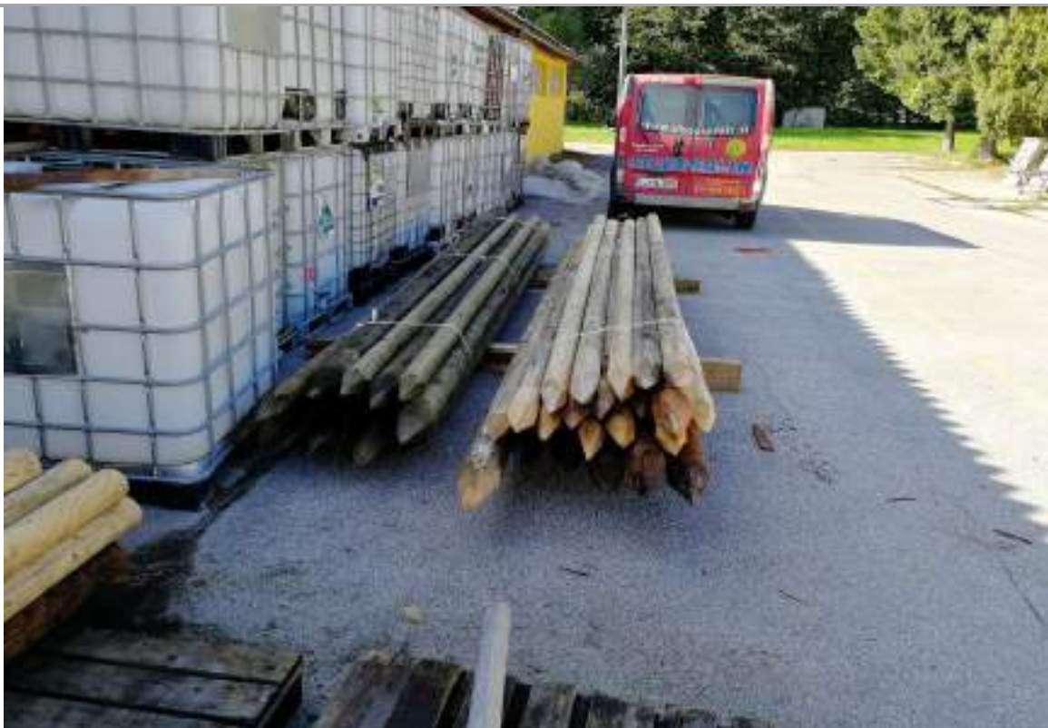
Slika 9: Zbrane okroglice posameznih obdelav; levo vakuumsko-tlačno impregnirani koli, desno neobdelane kontrole.