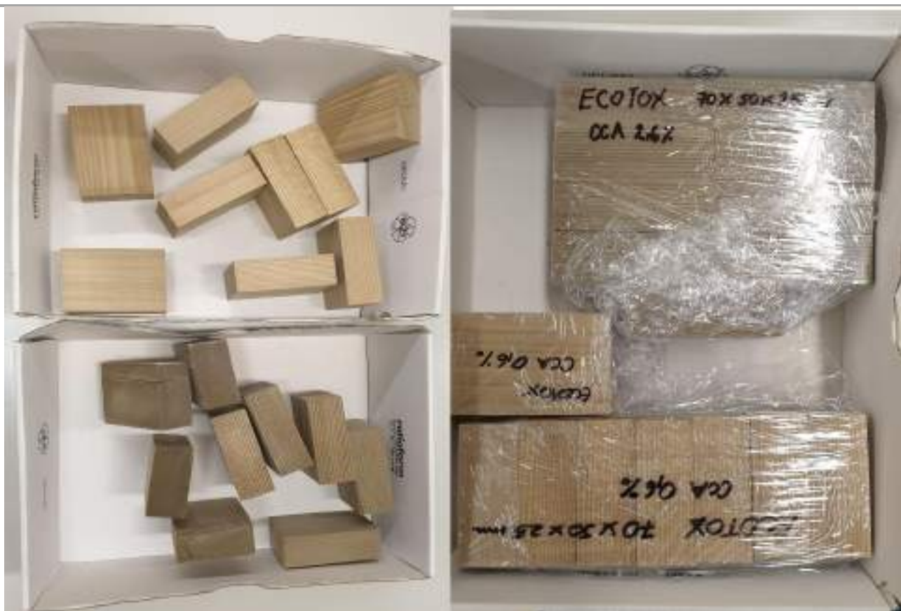
Figura2: Parte dei provini di dimensioni 70 × 50 × 25 mm per WP 3.3.3 (ATT16) e WP 3.3.4 (ATT17).