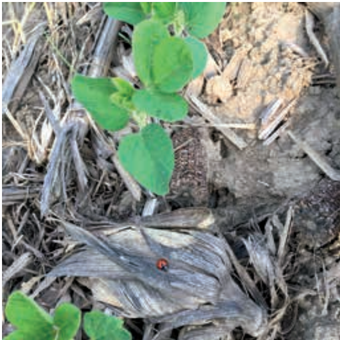
Soybean on covercrops (corn precession).