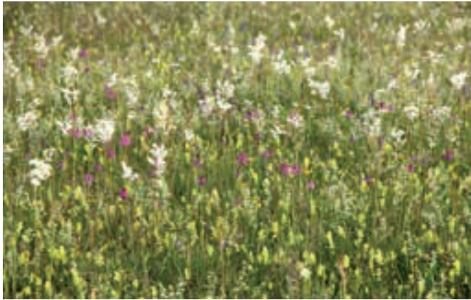
Magredile prairie in full bloom.