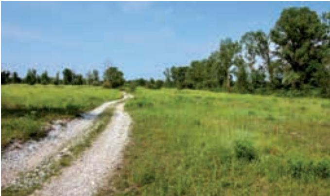
Meadows restored within the Greto del Tagliamento site. Prati ripristinati all'interno del sito Greto del Tagliamento. Obnovljeni travniki znotraj območja Greto del Tagliamento.

The growing interest and the consequent increasing use of the participatory approach in the decision-making processes of recent years, has highlighted an evolution as regards the conception and organization methods of participatory processes, preferring to a generic public participation, the involvement of real stakeholders.