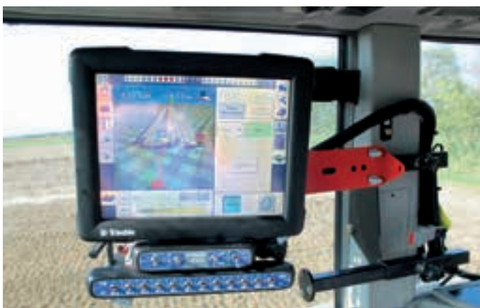
GNSS guidance system. Sistema di guida GNSS. GNSS sistem vodenja.

Precision Farming is certainly the main ‘basic’ innovation on which all future innovation will be built. All farming techniques, from fertilisation to IPM, will become increasingly efficient, and their potential benefits will grow, when performed with Precision Farming technology.