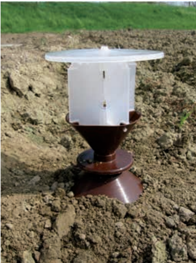
Yatorf trap to monitor click beetles. Trappola Yatorf per il monitoraggio degli elateridi. Lovilna past za monitoring hroščev pokalic.

European Union legislation made Integrated Pest Management (IPM) compulsory for all crops from January 2014 with Directive 2009/128/EC. IPM principles are designed to reduce the impact of agriculture on the environment, improve the cost/benefit ratio of crop-farming processes, and avoid the negative impacts on the organisms that ensure soil fertility, in particular the maintenance and/or increase of organic substances.