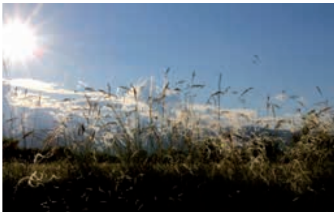
Flowering fairy flax (Stipa eriocalis) in the Friulian magredi.