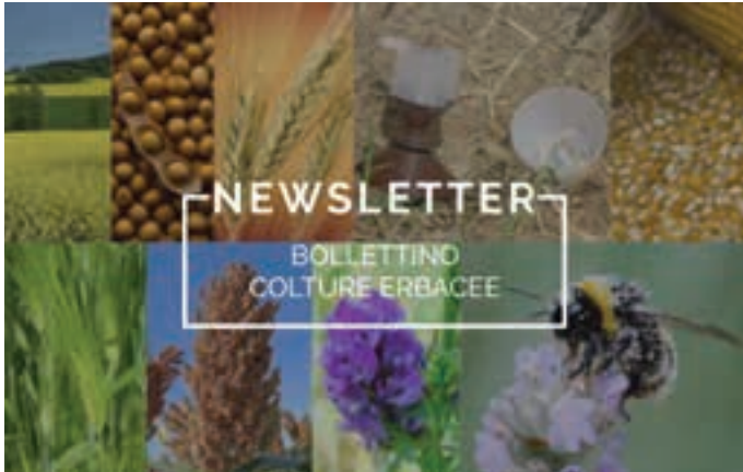
Annual Crops Bulletin. Bollettino colture erbacee. Bilten letnih pridelkov.

IPM will focus on insecticides, the category of plant protection products with the greatest potential impact on natural biodiversity. Its application will enable farmers to use alternatives to chemical pesticides, principally systemic ones, with any occasional use being governed by clearly documented emergency situations. IPM will also ensure a significant reduction in the use of other plant protection products.