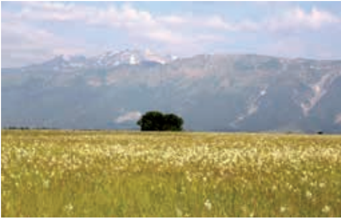
Magredili grasslands within the Magredi di Pordenone site. Praterie magredili all'interno del sito Magredi di Pordenone. Travišča Magredili znotraj območja Magredi di Pordenone.

The application of the vegetational coherence index and the hematobia index to surveys carried out in stable meadows therefore allow to evaluate their "purity" in vegetational terms and whether the disturbance is linked to the presence of species coming from crops. The use of the phytosociological method allows to return lists of floristic species with the relative abundances (coverages) observed in the test areas. It is possible to combine to these species their beekeeping interest, that is the preference by pollinator insects as regards the supply of pollen, nectar or honeydew. While for the wild apoidea this information is still fragmentary, for the domestic bees there are some reference publications able to satisfy this cognitive need. It is therefore possible to calculate the beekeeping interest of a meadow through the survey of the present flora.