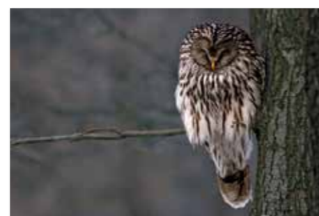
Allocco degli Urali - Kozača ( Strix uralensis )