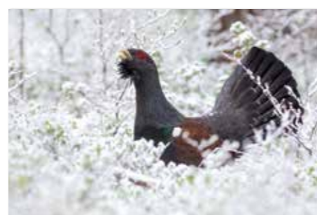
Gallo cedrone - Divji petelin ( Tetrao urogallus )

Ente parco naturale delle Prealpi Giulie Piazza del Tiglio 3 I-33010 Resia (UD) T: +39 0433 53534 info@parcoprealpigiulie.it www.parcoprealpigiulie.it