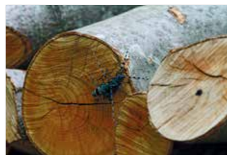
Rosalia alpina - Alpiski kozliček ( Rosalia alpina )