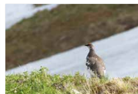
Pernice bianca - Belka ( Lagopus muta )