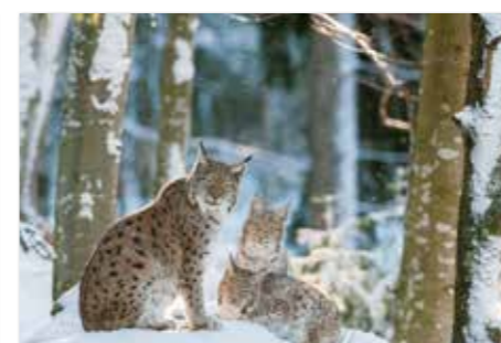
Lince - Navadni ris ( Lynx lynx )