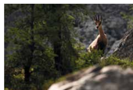
Camoscio alpino - Gams ( Rupicapra rupicapra )