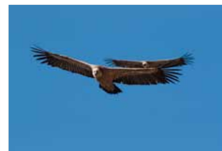
Grifone - Beloglavi jastreb ( Gyps fulvus )