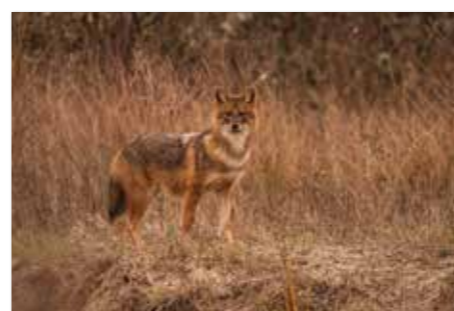
Sciacallo dorato - Zlati šakal ( Canis aureus )