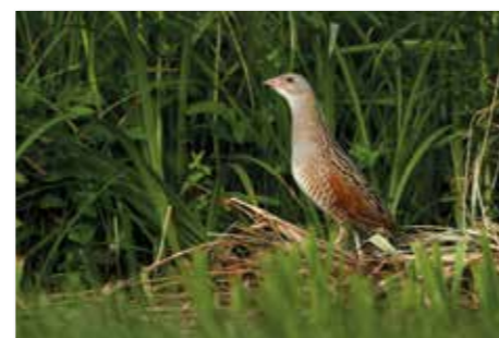
Re di quaglie - Kosec ( Crex crex )