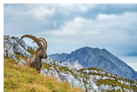
Stambecco - Kozorog ( Capra ibex )