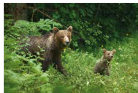
Orso bruno - Rjavi medved ( Ursus arctos )