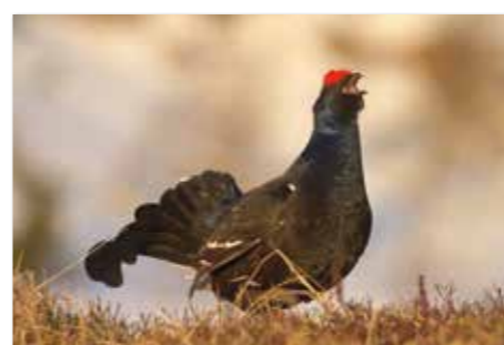
Gallo forcello - Ruševac ( Tetrao tetrix )