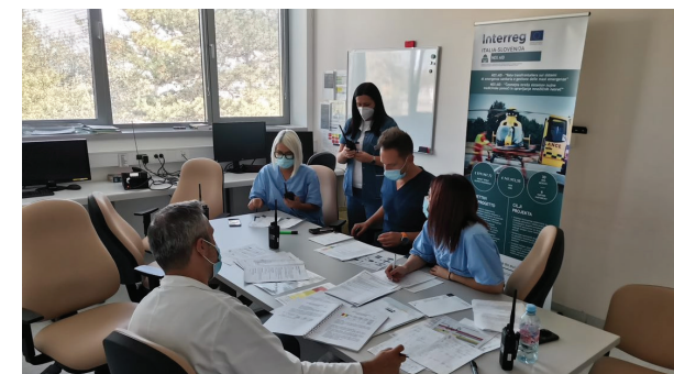
Testiranje opreme in protokolov