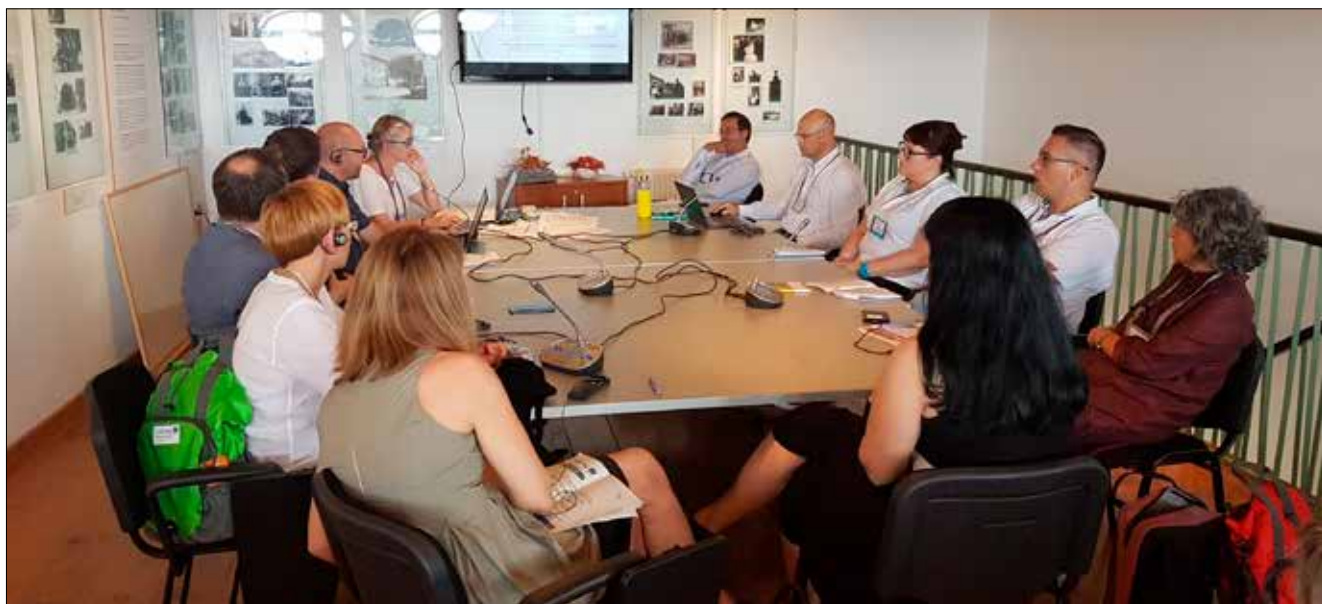
Udeleženci tematskega omizja s področja zdravstva junija 2019 v Štanjelu

Prav izziv izboljšanje prenosa znanj med zdravstvenimi inštitucijami in stroko je izpostavil tudi Interact v » Poročilu o zdravju in staranju na programih sodelovanja « kot dodana vrednost sodelovanja na področju zdravstva in staranja. Podane so tudi usmeritve za čezmejne programe za naslednje programsko obdobje, ki se osredotočajo na čezmejno mreženje in vzpostavitev skupnih čezmejnih zdravstvenih sistemov.