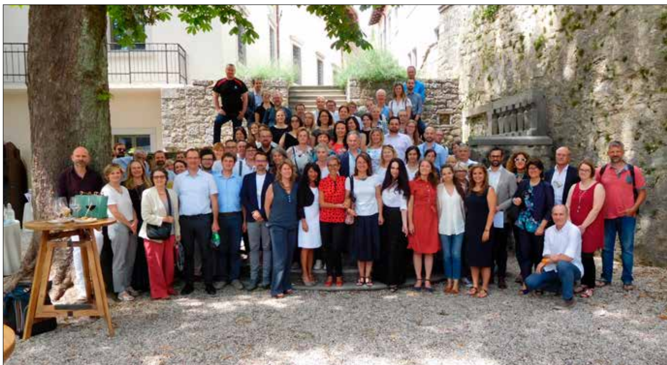
Udeleženci Letnega dogodka Programa sodelovanja v Štanjelu junija 2019

V okviru razprave na tematskem omizju s področja zdravstva z naslovom »Krepitev medinstitucionalnega sodelovanja pri izvajanju storitev na področju zdravstva« so sodelovali vodilni in projektni partnerji standardnih projektov CROSSCARE , MEMORI-NET , INTEGRA in edini upravičenec ter izvajalska telesa projekta SALUTE-ZDRAVJE : Cooperativa ITACA società cooperativa sociale onlus, Deos d.o.o, Univerza v Trstu, ZRS Koper, IRCCS Burlo Garofolo, Univerza na Primorskem, EZTS GO, SB Nova Gorica in Bolnišnica Idrija. To je bil prvi programski komunikacijsko-kapitalizacijski dogodek, na katerem so strokovnjaki iz različnih čezmejnih institucij, univerz, bolnišnic, zdravstvenih domov, zdravstvenih podjetij, centrov za celostno oskrbo, domov za starejše, izpostavili ključne cilje projektov in glavne rezultate projektov, ki so jih projekti naslovili podobne izzive s področja zdravstva oz. zdravstvenih storitev. Inštitucije so se aktivno vključile že v fazi priprave vsebine za tematsko omizje.