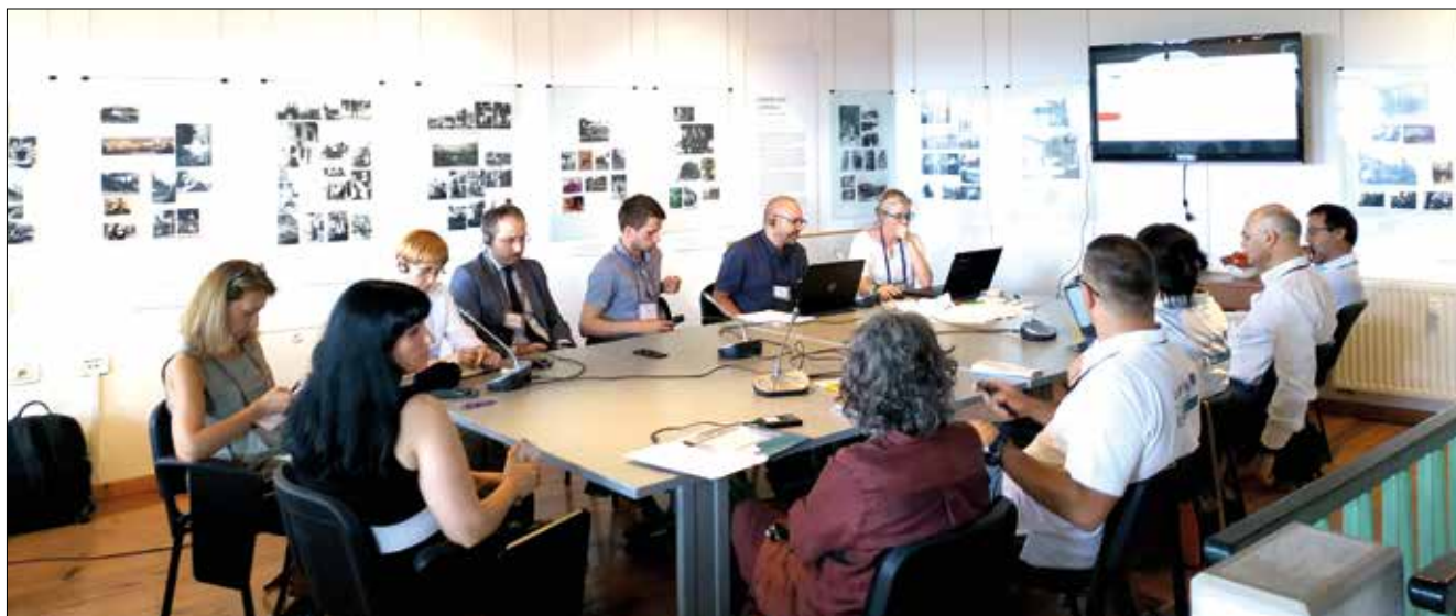
I partecipanti al tavolo tematico sulla salute, svoltosi a Štanjel nel giugno 2019

Il trasferimento di conoscenze tra settore scientifico e strutture sanitarie rappresenta una sfida, posta in evidenza anche da Interact nella sua “Relazione sulla salute e l’invecchiamento nei programmi di cooperazione” , quale valore aggiunto in questo tipo di collaborazioni. Gli indirizzi relativi ai programmi transfrontalieri per il prossimo periodo di programmazione si focalizzano sul networking transfrontaliero e la creazione di sistemi sanitari congiunti.