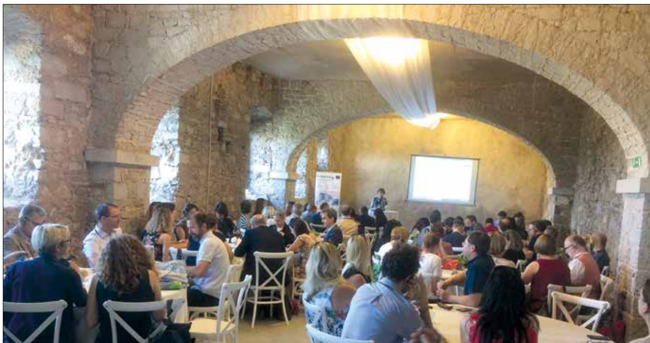
L'evento annuale a Štanjel nel giugno 2019.

Al dibattito del tavolo tematico sulla salute dal titolo »Rafforzamento della cooperazione interistituzionale nell'erogazione di servizi sanitari« hanno partecipato il lead partner e i partner progettuali, coinvolti nei progetti standard CROSSCARE , MEMORI-NET , INTEGRA , nonché il beneficiario unico e gli enti attuatori del progetto SALUTE-ZDRAVJE : Cooperativa ITACA società cooperativa sociale onlus, Deos d.o.o, Università degli Studi di Trieste, ZRS Koper, IRCCS Burlo Garofolo, Univerza na Primorskem, EZTS GO, SB Nova Gorica e Bolnišnica Idrija. Si è trattato del primo evento di Programma sul tema della comunicazione e capitalizzazione, in occasione del quale gli esperti di diverse istituzioni transfrontaliere, università, enti ospedalieri, case di cura, aziende sanitarie, centri assistenziali e case di riposo hanno esaminato gli obiettivi e i risultati principali dei progetti, andando ad analizzare le sfide da affrontare da entrambi i lati del confine nel settore della salute e dei servizi sanitari. Le istituzioni sono state coinvolte attivamente già nella fase di elaborazione dei contenuti del tavolo tematico.