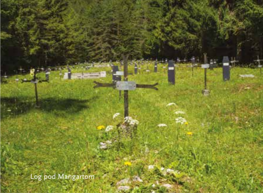
Log pod Mangartom