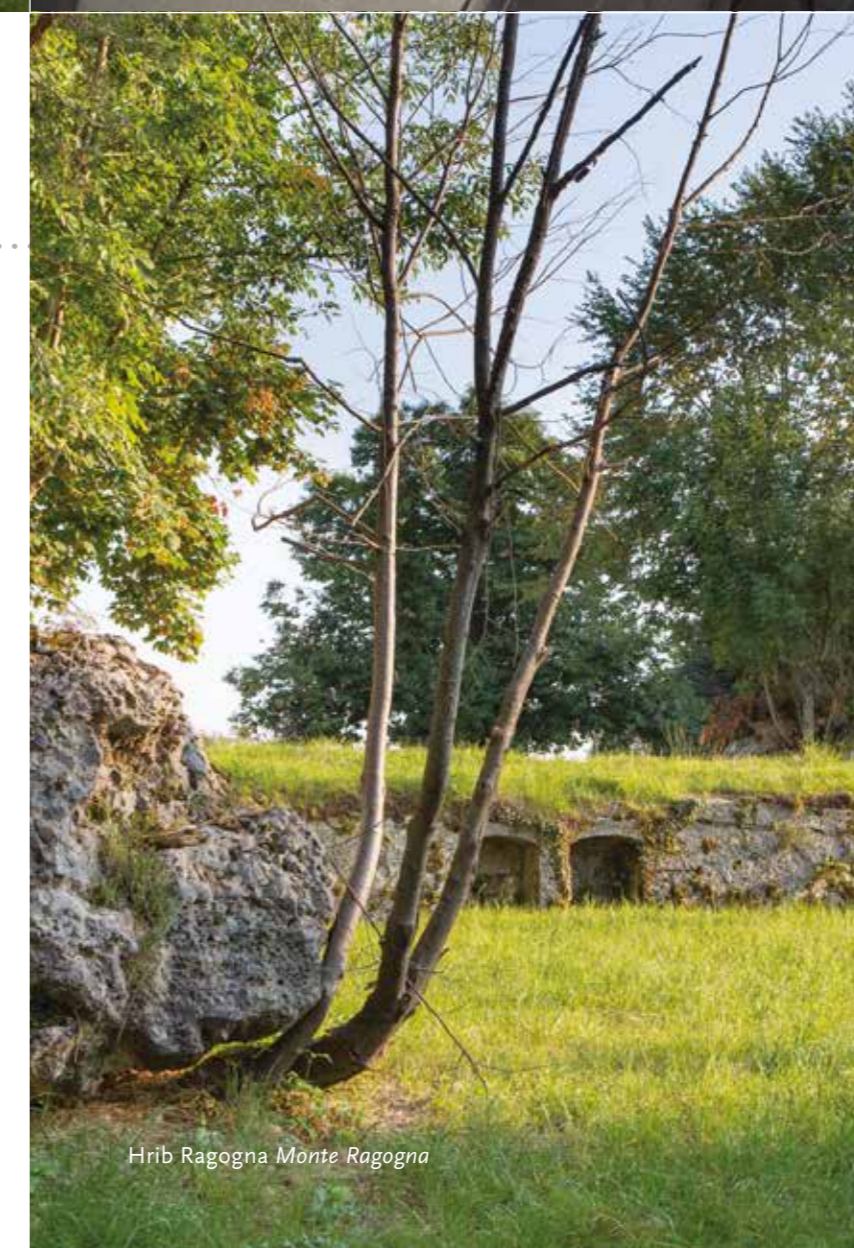
Hrib Ragogna Monte Ragogna

Strateško pomemben, 512 metrov visok hrib Ragogna, ki se dviga na levem bregu reke Tilment (Tagliamento), so Italijani začeli utrjevati že leta 1909. Po preboju pri Kobaridu in pomikanju avstro-ogrške in nemške vojske proti Tilmentu je italijanska vojska z utrjenih položajev Ragogne nekaj časa še preprečevala prodor čez rečne mostove. Danes je po grebenu hriba speljana pešpot. Iz izhodišča v Tabinah vodi do gradu Reunia, topniških položajev Ragogna Bassa, po grebenu do vrha in topniških položajev Ragogna Alta ter utrdbe Forte del Cavallino, po utrjenih položajih do cerkve sv. Janeza Puščavnika (San Giovanni Eremita), do opazovalnih in utrjenih položajev Cret dal Louf (volčji kamen po furlansko) in Spice (Vrh). Odičen zaključek krožne poti je ogled muzeja prve svetovne vojne Museo della Grande Guerra di Ragogna v San Giacomo.