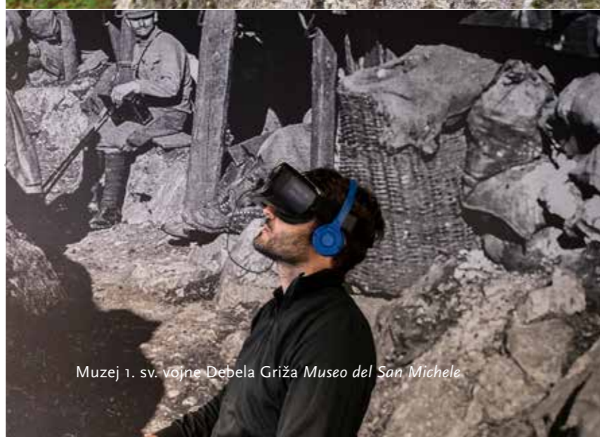
Muzej 1. sv. vojne Debela Griža Museo del San Michele

Debela griža je bila, skupaj s Sabotinom, med prvo svetovno vojno ena ključnih točk pri obrambi Gorice. Tu je avstro-ogrška vojska zgradila obsežen sistem kavern in zaklonišč, ki jih je opremila s topovi velikih kalibrov. Italijanska vojska je po več mesecih bojov v šesti soški bitki uspela zavzeti hrib in tu vzpostaviti obrambne položaje. Danes se tu lahko sprehodite po obnovljenih kavernah in zakloniščih ter si ogledate muzej prve svetovne vojne, ki je bil leta 2018 v celoti prenovljen in s svojo interaktivno multimedijko vsebino ponuja edinstveno doživetje.