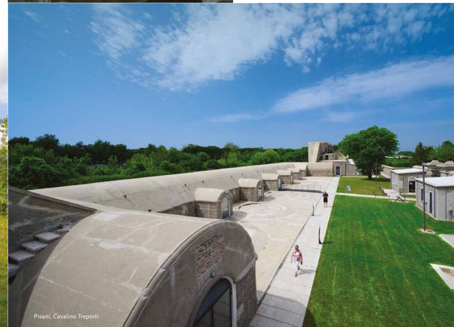
Pisani, Cavalino Treponti