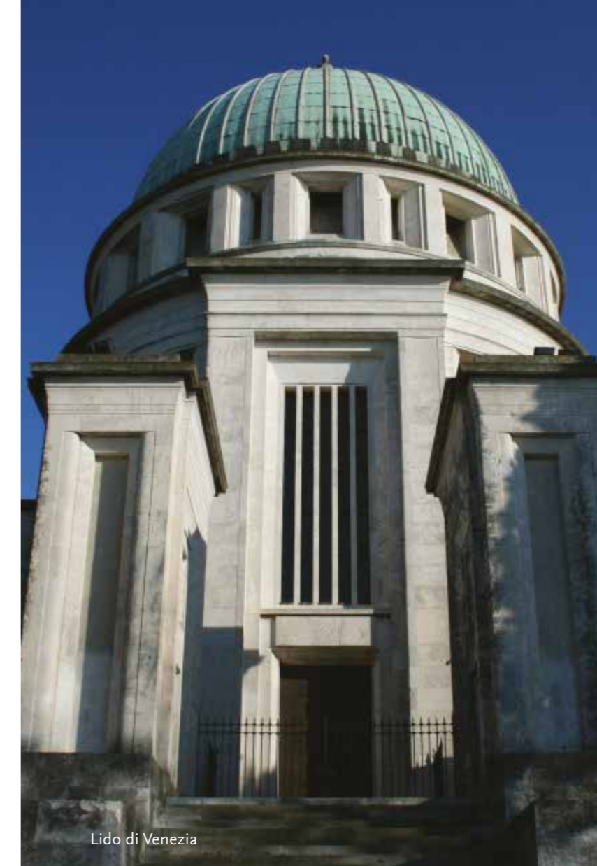
Lido di Venezia