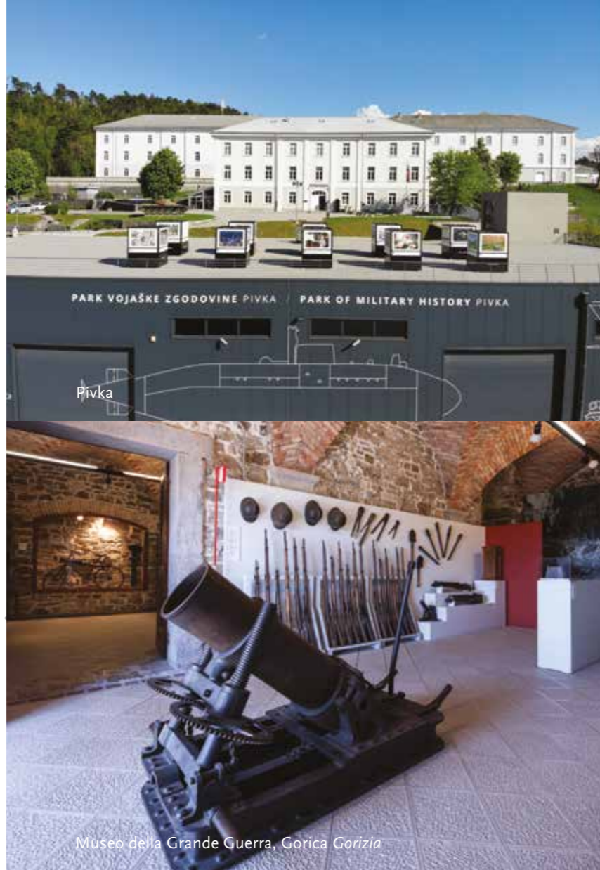
Museo della Grande Guerra, Gorica Gorizia

Muzej se nahaja v kletnih prostorih srednjeveške palače na grajskem griču (Borgo Castello). Predstavlja dogajanje v Gorici in na okoliških vzpetinah za časa prve svetovne vojne. Na ogled so različni predmeti in zgodovinske dragocenosti kot avstro-ogrski in italijanske uniforme, makete mesta in okoliških vzpetin Kalvarije/Calvario in Sabotina, soba posvečena generalu Armandu Diazu ter strelski jarek v naravni velikosti, kjer oglišujoč zvok granat obiskovalcu ponudi kratko izkušnjo življenja vojakov na fronti.