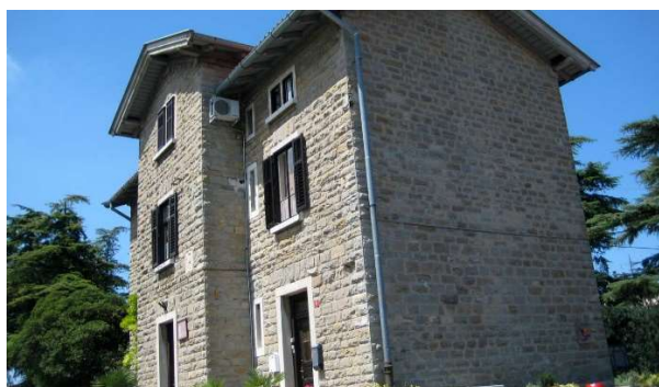
Stavba nekdanje železniške postaje v Izoli