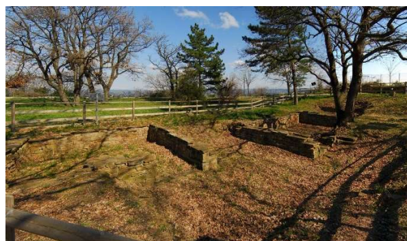
Ostanki postaje v Miljah