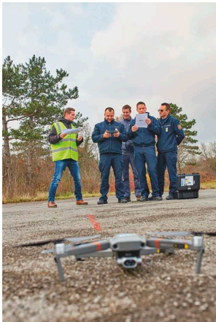
Usposabljanje slovenskih partnerjev L'addestramento dei partner sloveni

L'unione vigili del fuoco della Slovenia ha organizzato, come partner principale dell'esecuzione di tale attività in Slovenia, dei addestramenti per l'uso sicuro dei droni. I partecipanti hanno studiato la parte teorica, di cui anche quella legale, nella parte pratica invece hanno mostrato le proprie capacità nella gestione dei droni. L'addestramento si è concluso con un esame svoltosi tramite l'Agenzia per l'aviazione civile della Slovenia. Con lo scopo di un'efficienza maggiore dei droni sono stati acquistati, da alcuni partner, anche dei monitor grandi e dei sostegni che consentono la trasmissione delle immagini nella sede centrale della gestione interventi, cosa molto importante durante le emergenze.