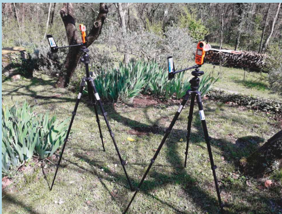
Vremenske postaje za spremljanje trenutnih izrednih razmer, ki jih je nabavila Benečija Stazioni meteorologiche acquistate dalla regione Veneto per seguire attuali condizioni d'emergenza

L'Unione vigili del fuoco della Slovenia ha acquistato, tramite il progetto, dei tablet per i partner sloveni del progetto previsti per l'uso durante gli interventi