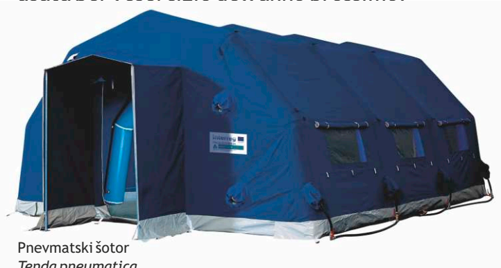
Pnevmatški šotor Tenda pneumatica

Il nostro partner del progetto 8 (Città metropolitana di Venezia) organizzerà un esercizio sul tema del rischio incendio boschivo nelle aree periurbane con la partecipazione dei volontari sia locali che metropolitani con lo scopo di esaminare le apposite procedure e i dati scaricati. A questo scopo la Città metropolitana di Venezia ha acquistato, oltre ad altra attrezzatura, anche una tenda pneumatica per gli operatori sulla sede comando, che verrà usata per l'esercizio dell'anno prossimo.