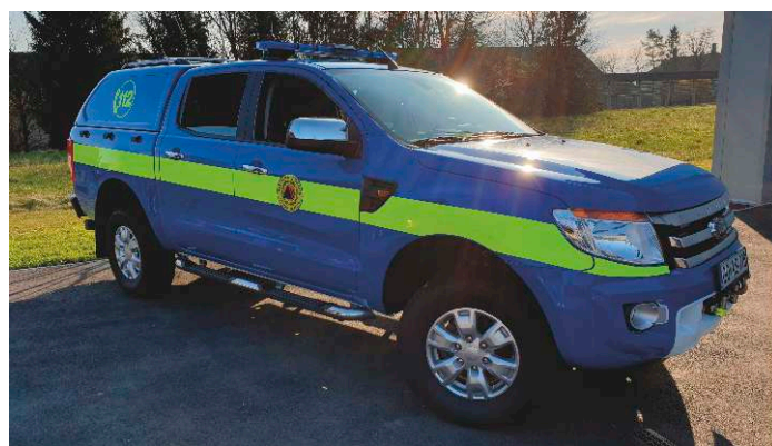
Nagradnja vozila Ford Ranger Il miglioramento del veicolo Ford Ranger

A proposito di esercizi dobbiamo menzionare anche il partner del progetto 2 (Comune di Ajdovščina) che eseguirà due esercizi a livello regionale sul tema della protezione civile, il primo riguardante incendi e il secondo riguardante terremoti. Uno dei risultati del progetto del Comune di Ajdovščina è stato il miglioramento del veicolo Ford Ranger. Oltre all'attrezzatura già esistente il PP2 ha montato sul veicolo un carrello estraibile con stazioni radiofoniche, un computer portatile, un proiettore, un gruppo elettrogeno, delle sedie, un tavolo, dei lettini mobili. Al veicolo menzionato è stata aggiunta anche una barra led con luci blu e segnaletica sonora ed è stato verniciato dei colori della protezione civile affinché possa definirsi un vero e proprio veicolo ufficiale per interventi. Inoltre è stata montata attrezzatura aggiuntiva anche su un veicolo dei vigili di fuoco di Ajdovščina - così potranno anche loro usufruirne durante interventi.