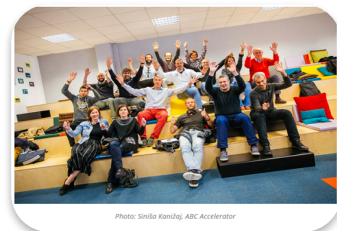
20 enterprises supported in SLO and IT