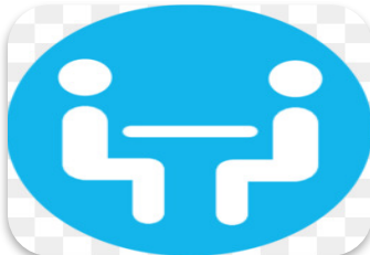
Cross-B mentor network 40 mentors involved