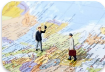
1 CAB Cross-Border Acceleration Model