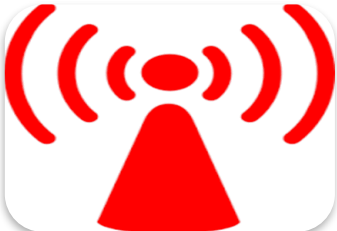
3 CAB POINTS (Lubjana-Udine-Venice)