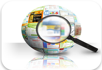
Study on Acceleration Models in IT-SLO /EU