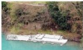
Il pontile al Parco di Piumazzo

naturalistica anche di sfruttamento nel lungo dove scorgeva l'attraversamento che aveva