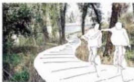
La piste ciclabile che si pensa di realizzare nella Capugnozza