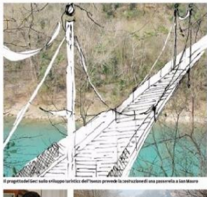
Il progetto del Gect sullo sviluppo turistico dell'Isonzo prevede la costruzione di una passerella a San Mauro

Il finanziamento delle opere In sintesi, verrà realizzata l'infrastruttura transfrontaliera di collegamento della pista ciclabile e pedonale del Parco dell'Isonzo al posto di Piumazzo alla diga della centrale idroelettrica di Salcano con gli attraversamenti del fiume e il Parco sportivo di Salsomaggiore al fine della creazione di un